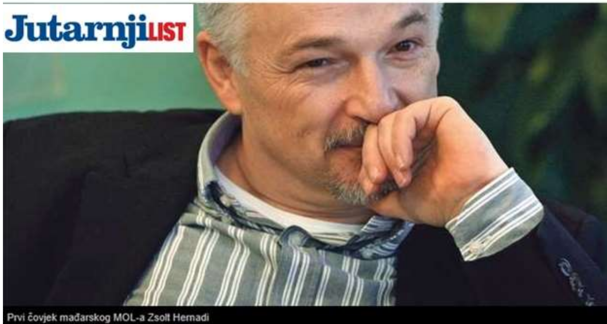
Prvi čovjek mađarskog MOL-a Zsolt Hernadi

činjenicama, „izazvao konsternaciju“ u vrhu MOL-a. Deoničarskim ugovorom iz 2003., kada je MOL za 505 miliona dolara postao strateški partner Ine, Mađari su se obavezali da će hrvatskog naftaša zadržati kao samostalnu, vertikalno integrisanu kompaniju, preuzeli obaveze ulaganja u istraživanje nafte i gasa, proizvodnju, preradu i maloprodaju. Rafinerije je trebalo da budu modernizovane, a maloprodajna mreža proširena na tržišta jugoistočne Evrope. Analiza pokazuje da je Ina izgubila na vrednosti u svim segmentima poslovanja. Od 2009. do danas rezerve ugljikovonika smanjile su se za 23%, a proizvodnja za 30%. Da su rafinerije modernizovane, Ina je mogla da zaradi dodatnih 564 miliona dolara. Od 2009. do danas kapitalne investicije su se smanjivale po stopi od 40% godišnje, dakle, gotovo pet puta ukupno. Da je Ina zadržala tržišni udeo koji je uoči sklapanja ugovora sa Mađarima imala u Hrvatskoj i proširila se, prema predviđanjima, na tržišta jugoistočne Evrope, njen promet u maloprodaji mogao je biti gotovo 47% veći. Međutim, potpuno suprotno ugovoru, MOL je ušao na maloprodajno tržište Hrvatske i Srbije i tako „krao“ Inin prostor i prihod. Ukupno je poslovanje Ine danas na 17% nižem nivou od ulaska MOL-a. Kad se sve sabere, u Ministarstvu privrede već su izračunali da je u Hrvatskoj samo na osnovu lošijeg poslovanja Ine, izgubljeno 1,5% BDP-a.